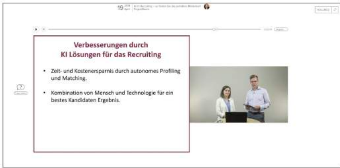
ProjectRoom Q&A im virtuellen Meetup

Ganz ohne den eigenen Standort verlassen zu müssen, konnten alle Teilnehmer bequem vom eigenen Desktop aus der live Videoübertragung zusehen und sich dank der Chatfunktion mit dem ProjectRoom Team austauschen. So war es deutschlandweiten Kunden möglich mit ProjectRoom in Kontakt zu treten und von den vielfältigen Tools des Webcasts zu profitieren. Die Kombination aus professionellem Service und Interaktivität verlieh dem Event eine persönliche und moderne Note, die durchgehend positives Feedback erhielt.